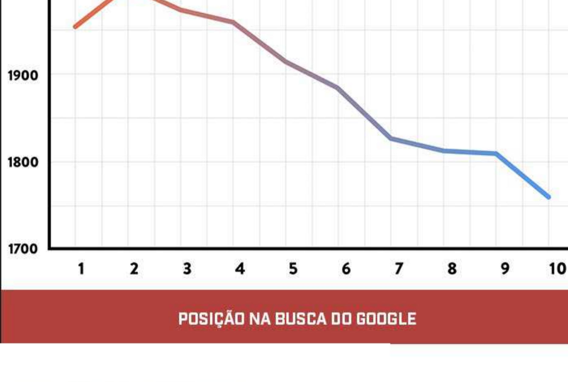
PALAVRAS x POSIÇÃO NA BUSCA

SIM. A Quantidade de caracteres influencia diretamente no ranqueamento e a autoridade do link, de acordo com o pessoal da Backlinko. A média dos primeiros resultados em uma busca do Google contem 1890 palavras. 7,8